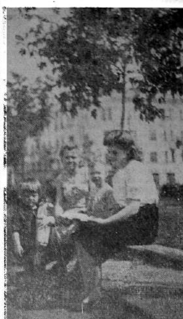
В одном из уголков сквера у здания исполкома райсовета.

Выставка открыта с 15 по 30 июля в помещении Московской областной станции юных натуралистов и техников: Москва, Никитский бульвар, дом № 12/а. Открыта с 12 часов дня до 5 часов вечера.