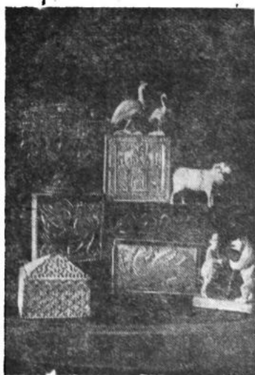
Экспонаты отдела народно-художественных ремесел при Загорском музее-заповеднике. Резьба по дереву—различные работы местных мастеров в довоенные годы.

В субботу, 18 ноября, в 7 часов вечера, в паркиноте ГК ВКП(б) для докладчиков и агитаторов ооостоится доклад на тему: «О Дне артиллерии». ГК ВКП(б).