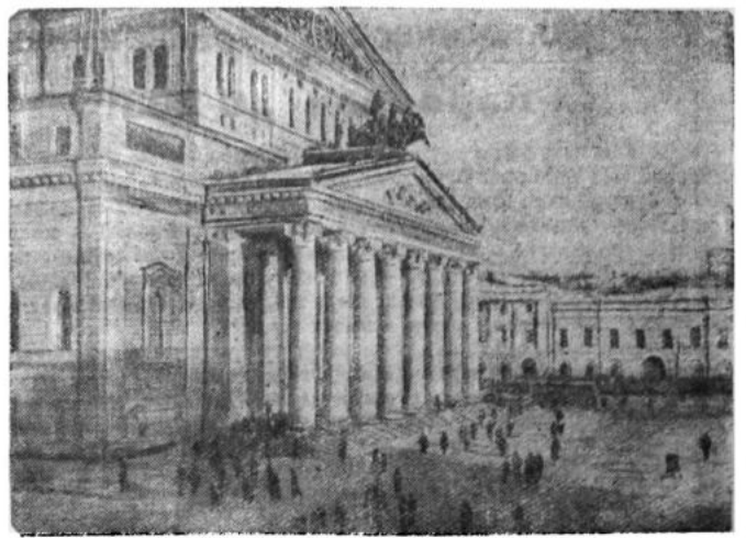
Москва. Государственный ордена Ленина Академический Большой театр Союза ССР. Здесь проходило торжественное заседание, посвященное 29-й годовщине Великой Октябрьской Социалистической революции.

Все присутствующие горячо поддерживали выступающих товарищей.