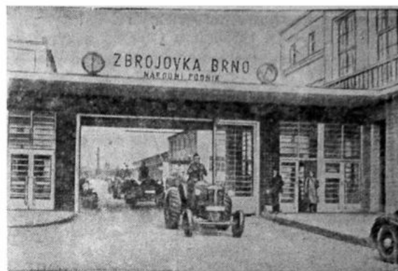
Чехословакия. На заводе «Збровка» в Брно. Тракторы марки «ЗЕТ» выходят из заводских ворот.