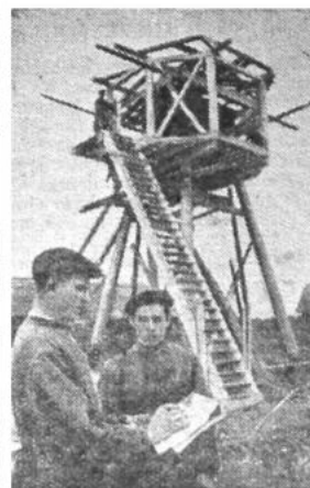
Предприятия Ленинграда помогают колхозам в организации водоснабжения на животноводческих фермах.

С большим воодушевлением участники митинга приняли приветствие великому вождю народов товарищу И. В. Сталину.