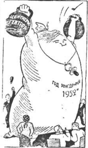
Вот богатый! Гляди и уважай Колхозный труд. Об этом здесь заметки. Богатый трудодень Дает нам урожай Второго года новой пятилетки!

Средняя стоимость одного трудодня в этом году равна, примерно, 25 рублей.