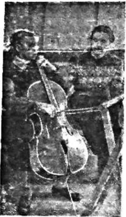
Многие школьники нашего города с интересом занимаются в музыкальной школе. Девочки и мальчики в различных классах получают здесь музыкальное образование.

ДОМ КУЛЬТУРЫ Сегодня, 16 ноября новый спектакль-комедия «Шелковое сызганэ». Постановка областного театра им. А. Н. Островского. Начало в 8 часов.