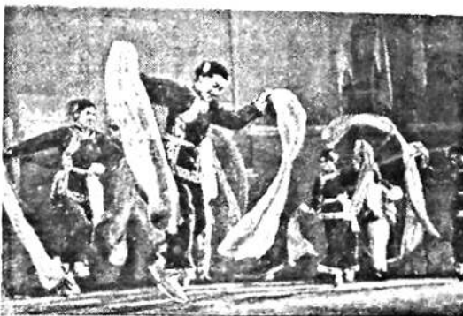
На снимке: танцевальная группа ансамбля китайской молодежи исполняет «Танец с шелком».

Выступление артистов Китайской Народной Республики в Концертном зале имени П. И. Чайковского вызвало огромный интерес московских зрителей. В программе концерта были произведения современных и старинных китайских композиторов, народные песни и танцы.