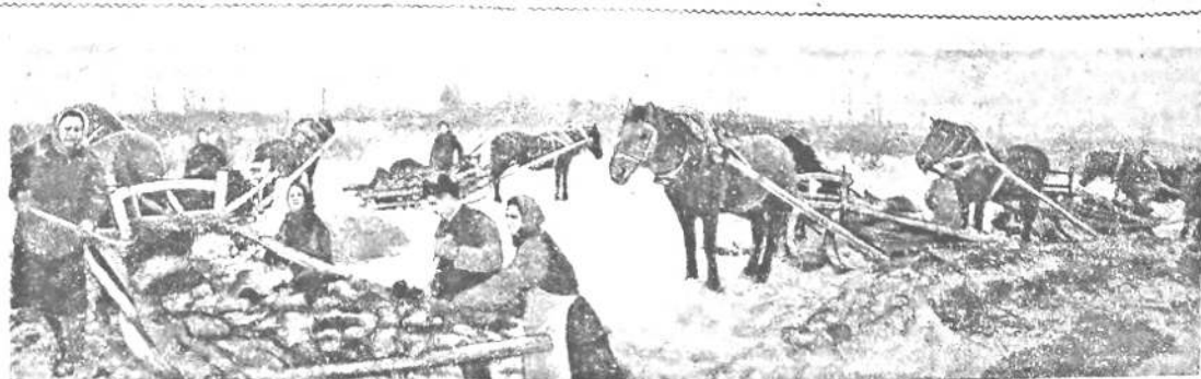
Колхоз имени Горького. Готовясь к весеннему севу, члены сельхозартели вывозят торф на поля. Добавая к нему навоз и фосфоритную муку, колхозники готовят ценное удобрение — торфо-навозный компост. Его заготовлено уже более 300 тонн. На снимке: вывозка торфа в бригаде № 2.

Необходимо и таким модам колхозам, как им. Ленина, им. Хрущева, «Путь Ленина» значительно повысить темпы накопления и вывозки удобрений. Надо сделать так, чтобы в каждой полеводческой бригаде было закреплено на вывозку навоза определенное количество рабочей и тягловой силы, чтобы члены правления ежедневно контролировали ход выполнения этого задания.