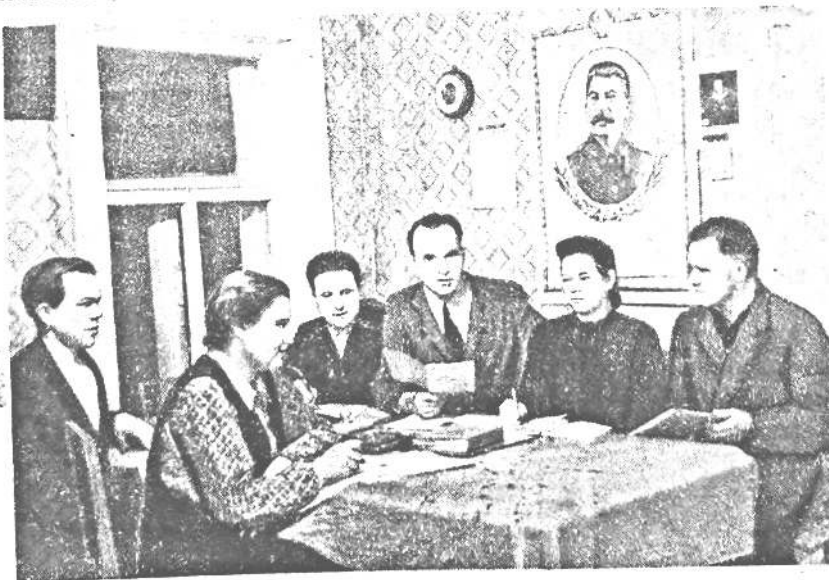
Коммунисты колхоза имени Миленина повышают свои политические знания в кружке по изучению «Краткого курса истории ВКП(б)». Сейчас слушатели заканчивают изучение темы: «Партия большевиков в период перехода на мирную работу по восстановлению народного хозяйства».

По просьбе зрителей фильм «Правда хорошо, а счастье лучше» будет демонстрироваться еще несколько дней.