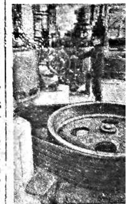
В Вязниковской области с каждым годом увеличивается число скважин электростанций. Сейчас насчитывается свыше 400. В козырьках домов все больше является электростанций. На снимке: в турбинном колхозной гидроэлектростанции в Любимском районе на реке Юга Буга.

Многочисленные восстановленные инструменты. Например, на заводе «Ворошилова» восстановлено несколько тысяч инструментов. Экономия металла и в других предприятиях.