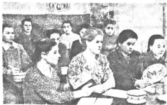
Профтехшкола им. С. Халтурина. Одно из основных отделений в школе — это отделение художественной росписи о вымываем по дереву. Здесь с большим интересом занимается молодежь. На снимке: учащиеся второго года обучения на практических занятиях по художественной росписи.