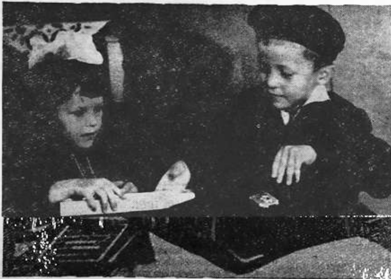
Завтра в школу.

Школа, родители должны с первых дней учебы ребенка го-