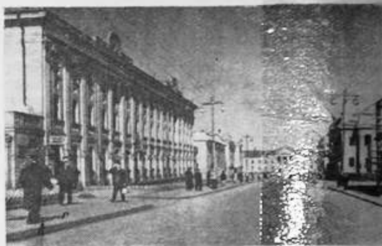
Боркута, Московская улица