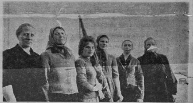
На совещании животноводов совхоза «Хотьковский», состоявшемся 12 апреля, переходящее Красное знамя вручено коллективу работников Морозовской МТФ.