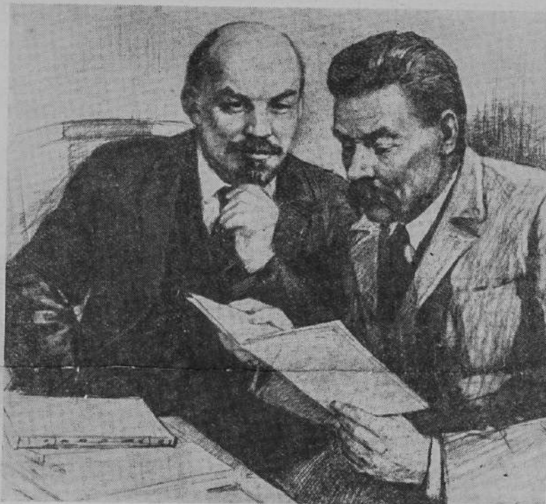
В. И. Ленин и А. М. Горький.

Вот так растет наша городская парторганизация за счет передовых людей. И если (вспомним!) в 1918 году партийная организация к моменту ее создания насчитывала всего лишь 9 коммунистов, то теперь в ее рядах многие тысячи.