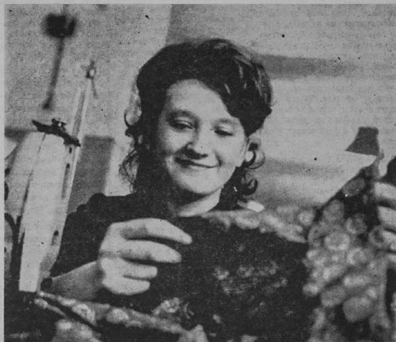
В самом начале апреля швейный Загорский филиал «Юность» на своем общем соб-