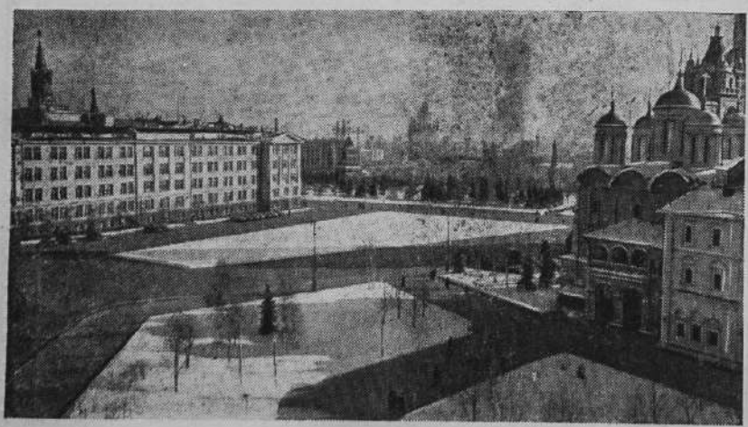
Москва сегодня. Ивновская площадь Кремля (вид из Кремлевского Дворца съездов).