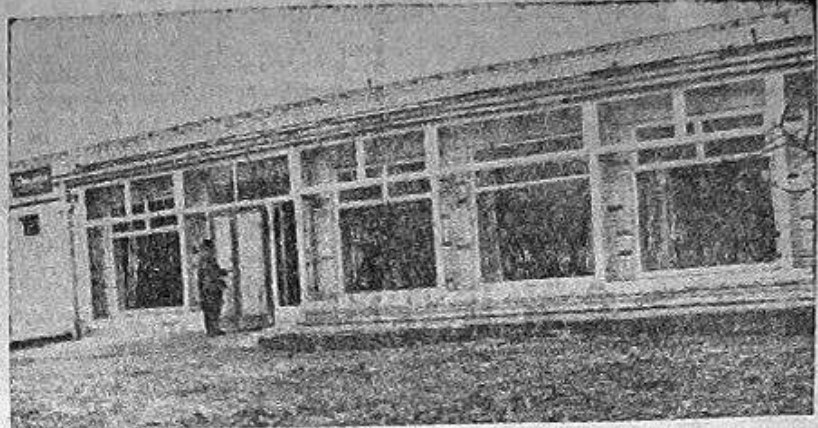
Большое внимание уделяется у нас улучшению бытового обслуживания труженников села. Там, где раньше еще одно предприятие общественного питания появилось в совхозе «Константиновский». Новая столовая открыта на его центральной усадьбе. Здание построено по современному проекту. В нем удобно и посетителям, и обслуживающему персоналу.

Лучших результатов по закупке сельскохозяйственных продуктов у населения добились такие сельские Советы, как Константиновский и Веригинский. Не выполнили социалистические обязательства Веригинский, Наугольновский, Торжешинский сельские Советы. Совершенно не проводили работу по закупкам сельскохозяйственных продуктов у населения Кузьминский, Марынский, Закубанский, Выпускский сельские Советы. В выполнении социалистических обязательств по благоустройству населенных пунктов отличились Митинский сельский Совет. Исполком горсовета по итогам социалистического соревнования присудил первое место Константиновскому сельскому Совету, которому будут вручены Почетная грамота и переходящее Красное знамя.