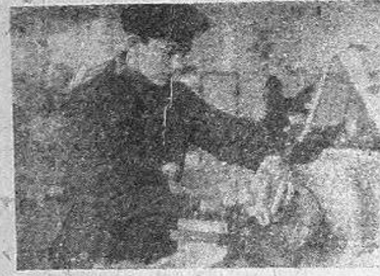
На этих снимках вы видите ребят, занимающихся в различных классах и мастерских.

УЧИЛИЩЕ ГОТОВИТ ТАКЖЕ СЛЕСАРЕЙ-РЕМОНТНИКОВ ШИРОКОГО ПРОФИЛЯ И ТОКАРЕЙ ДЛЯ НУЖД МЕТАЛЛООБРАБАТЫВАЮЩЕЙ ПРОМЫШЛЕННОСТИ.