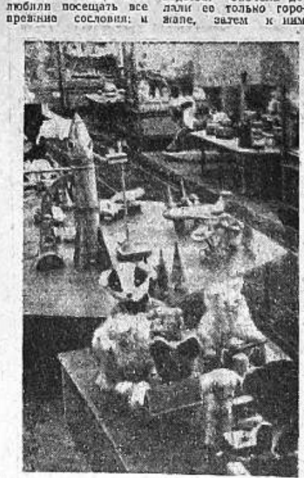
СОТНИ САМЫХ РАЗНООБРАЗНЫХ ИГРУШЕК СОБРАНЫ В ДЕМОНСТРАЦИОННОМ ЗАЛЕ ИНСТИТУТА.