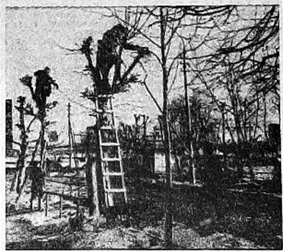
СОТНИ ДЕРЕВЬЕВ УКРАШАЮТ УЛИЦЫ НАШЕГО ГОРОДА. ВЕСНОЙ РАБОТНИКИ КОМБИНАТА БЛАГОУСТРОЙСТВА ЗАНИМАЮТСЯ ПРОФИЛАКТИКОЙ: ПОДРЕЗАЮТ КРОНЫ ДЕРЕВЬЕВ, УДАЛЯЮТ ПОВРЕЖДЕННЫЕ СУЧЬЯ. БОЛЬШУЮ ПОМОЩЬ В ОЗЕЛЕНЕНИИ И УХОДЕ ЗА НАСАЖДЕНИЯМИ ОКАЗЫВАЮТ И ПРЕДПРИЯТИЯ ГОРОДА.

совсем утаить с дерева, а другие на линочке держатся. Надо очистить домики от старого мусора. Одним словом — приготовить настоящие квартиры для наших пернатых друзей. И еще: не обижайте воробья — они весьма полезны; пусть живут себе возле наших домов; и вам зачатнее, и польза больше. В. ТИХОБРАТОВ, член общества охраны природы.