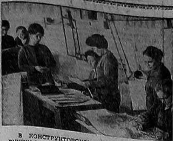
В КОНСТРУКТОРСКОМ БЮРО ИНСТИТУТА ИГРУШЕК ИДЕТ ОБЫЧНЫЙ, КАК ВСЕГДА НАПРЯЖЕННЫЙ, ТРУДОВОЙ ДЕНЬ.

Во всем Советском Союзе существует всего лишь один — единственный институт игрушки. Этот институт находится у нас в Загорске на самом южном месте, напротив историко-художественного музея-одежда. То, что именно в нашем городе 40 лет тому назад организовали коллектив художников, конструкторов, технологов и прочих специалистов, послышался своеобразием создания детской игрушки, и что место их работы по соседству с музеем, не случайно. Причинная связь между этими фактами, Юрия ее затрагивают в глубинах веков.