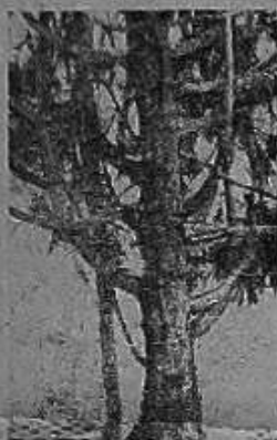
Фото и текст Н. ГРИГОРЬЕВОЙ.

Зашумел зеленый лес. Вы отдыхаете в нем, бродите по лесным полянам, восхищаетесь красотой природы. Прикажитесь к ней, внимательно, с любовью, и она щедро откроет вам свои тайны.