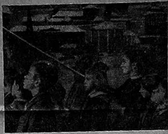
Работа расширяют свой познание. Они изучают историю бит-

1 сентября первый урок для всех классов посвящается рассказу о боях в пути 1-й Ударной армии. В ноябре проходит большая линейка в честь юбилея, на которой рассказывают о подвигах героев, которые служат примером для подражания.