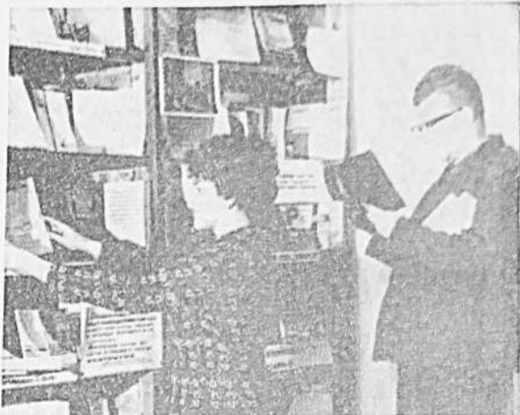
Более 50 тысяч книг имеет в своем фонде районная библиотека. Она насчитывает более пяти тысяч читателей. На снимке: у книжных полок библиотеки.

Роль Чигирина, на мой взгляд, удалась. Да и сам фильм жизнен, актуален. Правильный фильм. И хочется поступки свои мерить по Чигирину. И жить, как живет он. И трудиться так же, как он, чтобы всегда можно было смело смотреть людям в глаза. Н. БОЖЕДОВОА.